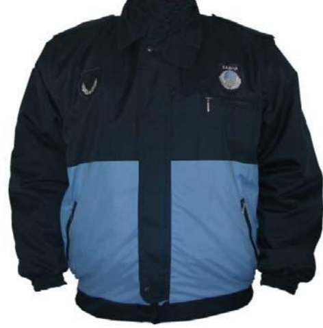
Montun önden görünüşü

Bu kısma belediyenin ismi yazılacak. Örneğin “BÜYÜKŞEHİR BELEDİYESİ, İL BELDİYESİ, A İLÇE BELEDİYESİ, A İLK KADEME BELEDİYESİ ve A BELDE BELEDİYESİ ”şeklinde yazılacak.