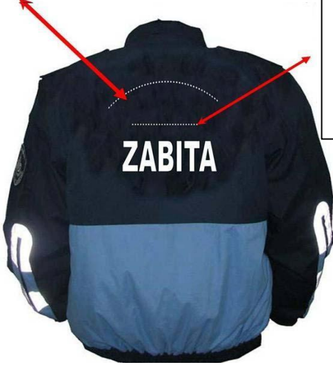
Montun arkadan görünüşü

Bu kısma zabitanın bağlı olduğu ilin adı yazılacaktır.