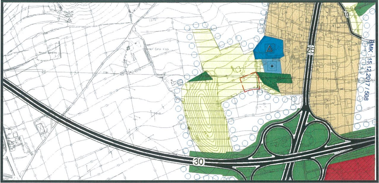
Şekil.1. 1/5000 Ölçekli Mevcut Nazım İmar Planı

Planlama alanı 1/5000 ölçekli Nazım İmar Planında "Gelişme Konut Alanı" olarak planlı bulunmaktadır.