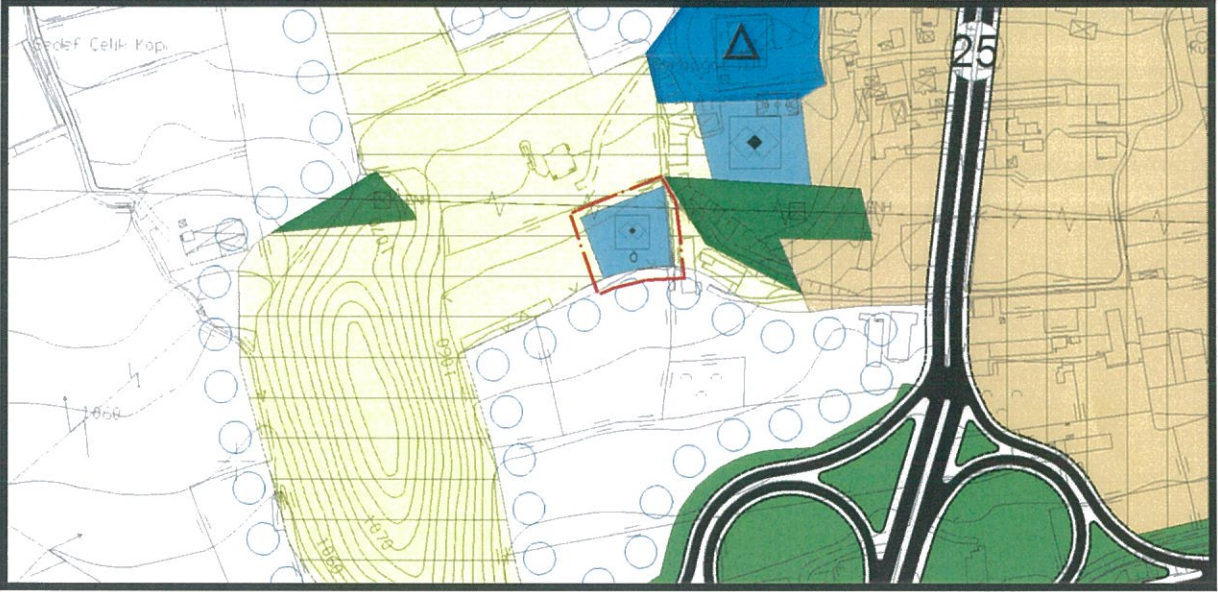
Şekil.3. 1/5000 Ölçekli Öneri Nazım İmar Planı