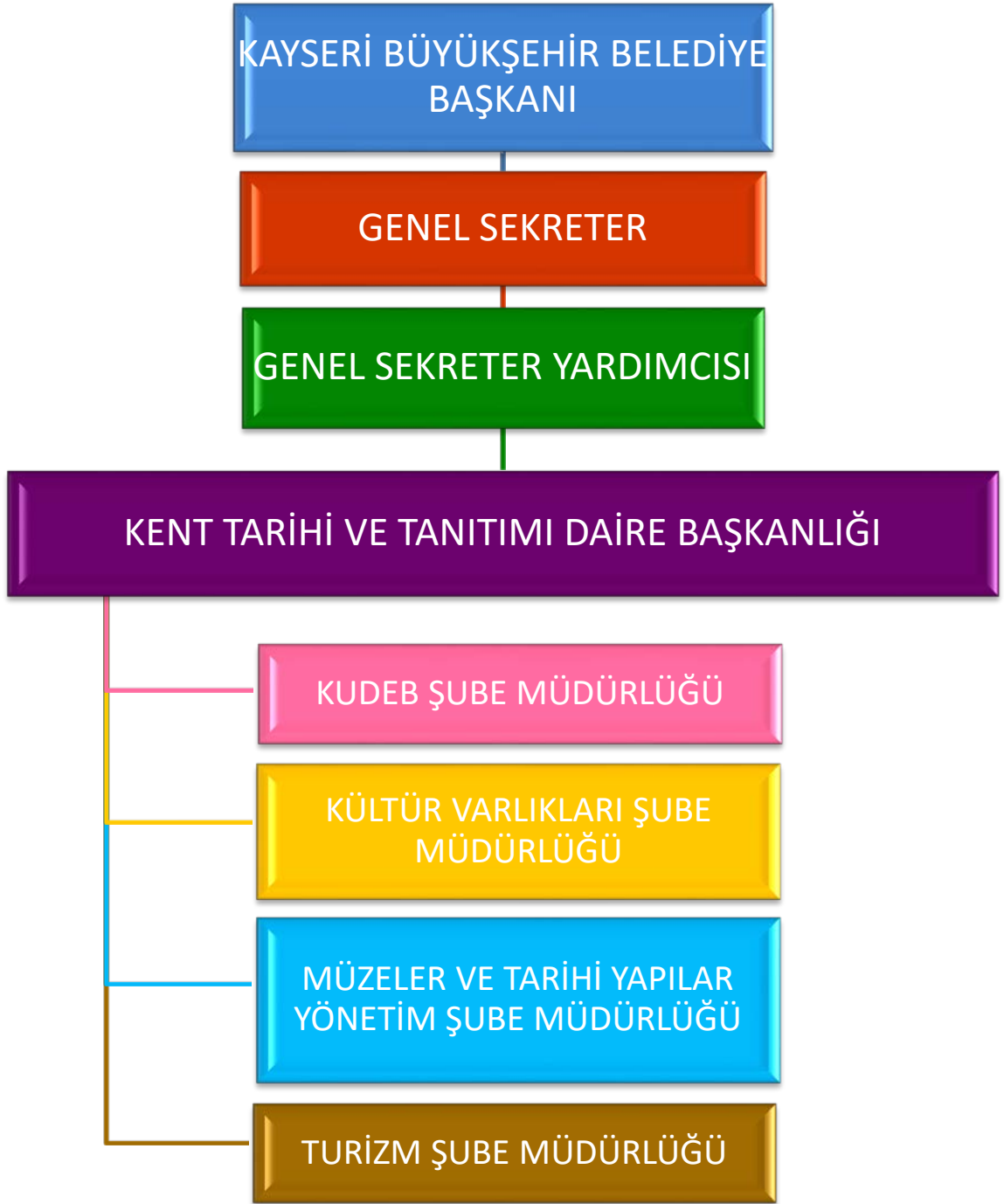
Kent Tarihi ve Tanıtımı Daire Başkanlığı Teşkilat Şeması